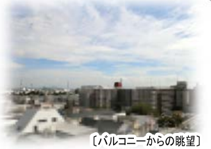
(バルコニーからの眺望)