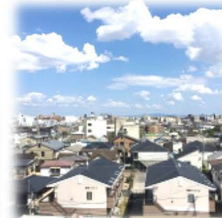
〔バルコニーからの眺望〕