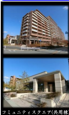
コミュニティスクエア(共用棟)