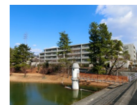
～ニテコ池周辺に広がる四季折々の 緑豊かな景色の変化を感じることが できる落ち着いた住環境です～